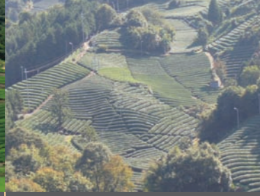
B Erihara 撰原（松尾）の茶畑

春、和東の町は西から東へと順に暖かくなり、西に位置するこの地域は「早場（はやば）」と呼ばれ、4月下旬には早くも茶摘みが始まります。近代的な農園整備がなされ、空まで続く茶畑が見られます。