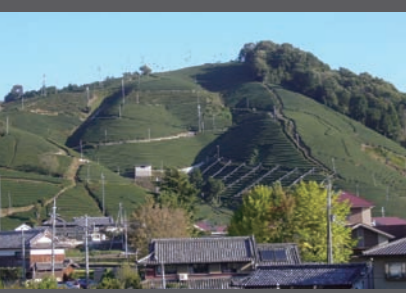
C Kamatsuka 釜塚（南部）の茶畑

和東の茶畑は、川沿いから見上げるだけでは想像がつかないほど、急傾斜の山の上にも広がります。この地域では傾斜に合わせて、パッチワークのように繊細に畝が巡らされ、まさに「山畑」と言えます。