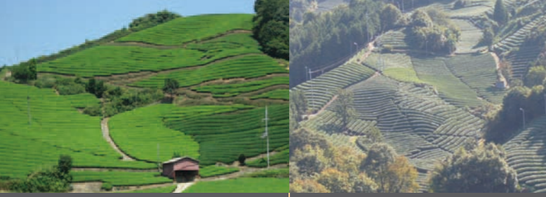
A Shirasu / Ishitera 白栖・石寺の茶畑

春、和東の町は西から東へと順に暖かくなり、西に位置するこの地域は「早場（はやば）」と呼ばれ、4月下旬には早くも茶摘みが始まります。近代的な農園整備がなされ、空まで続く茶畑が見られます。